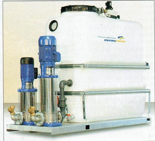
SERIE SPLIT-O-MAT® ECO 10- 35