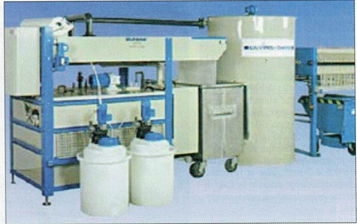
SERIE SPLIT-O-MAT® SOM 1500 - 3000 - 3200 - 4200