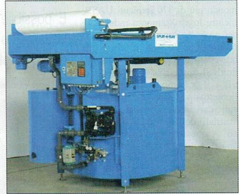
SERIE SPLIT-O-MAT® SOM 200 - 800 - 1000/1100 - 2000